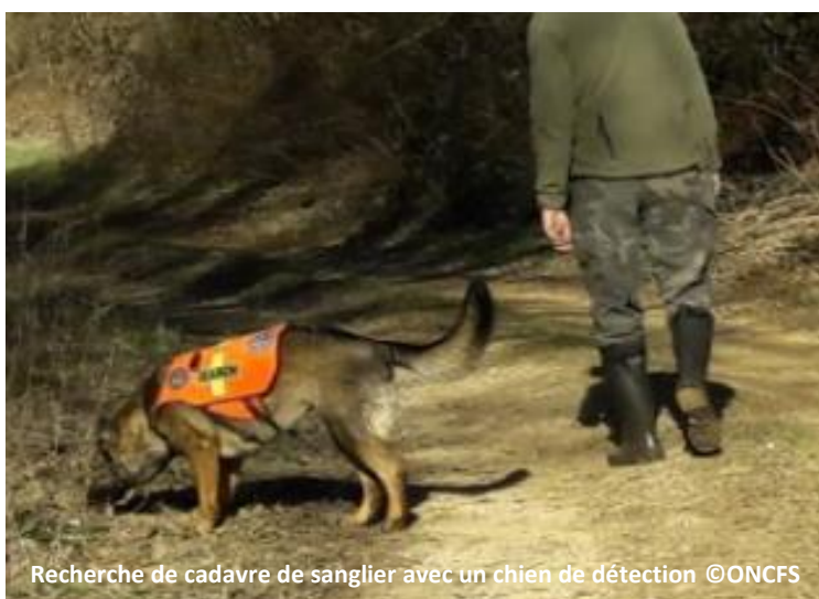
Recherche de cadavre de sanglier avec un chien de détection

Un cadavre a été détecté par ce moyen en zone blanche la semaine 9.