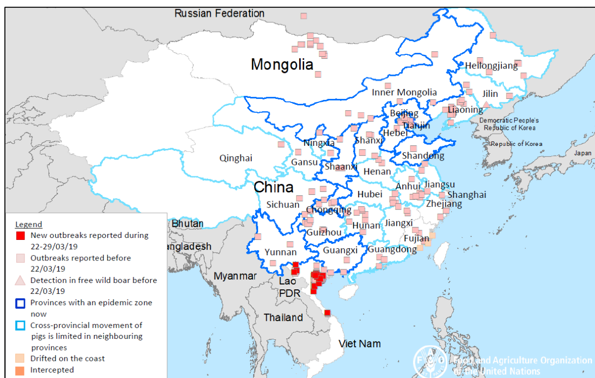
Figure 2. Localisation des foyers de PPA en Asie

De plus, le virus de la PPA sous sa forme infectieuse a été détecté pour la première fois dans des saucisses de porc contaminées, saisies par les autorités japonaises à l'aéroport de Chubu à proximité de Nagoya le 12 janvier 2019. Les saucisses ont été ramenées de Chine par deux passagers en provenance de Shanghai et Qingdao en Chine (source : Japan Times via ProMED). Pour rappel des aliments contaminés ont été détectés à ce jour dans plusieurs pays de la zone Asie-Pacifique (Australie, Corée du Sud, Thaïlande, Taiwan).