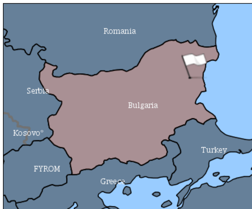
Figure1. Localisation du premier foyer de PPA en Bulgarie dans la région de Varna.

Un premier foyer de peste porcine africaine (PPA) a été confirmé en Bulgarie le 31/08/2018 dans la région de Varna. Il se situe dans un élevage de petite taille (sept porcs).