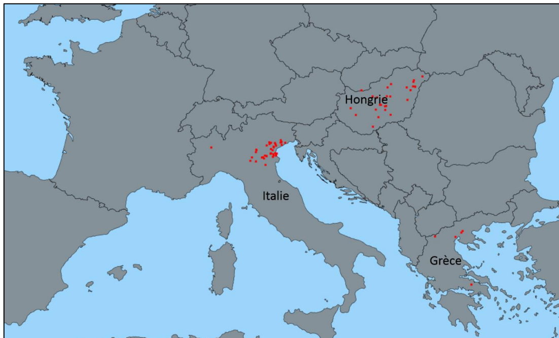
Figure 2. Localisation des foyers équins de fièvre West Nile en Europe en 2018.

Jusqu'à présent, la voie d'introduction virus West-Nile à Halle n'est pas connue (par ailleurs, il n'est pas précisé depuis combien de temps cette chouette était dans le zoo). D'autres analyses génétiques sur le virus et des enquêtes épidémiologiques pourront fournir des indications. Des enquêtes sont également actuellement en cours pour détecter la présence de virus West-Nile chez les moustiques à proximité du cas.